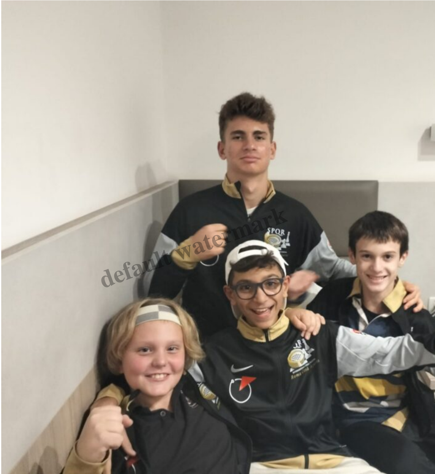
Trambusto in camera..